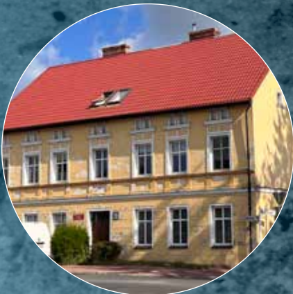
Pracownia Archeologiczna przy Ośrodku Archeologii Średniowiecza Krajów Nadbałtyckich Instytutu Archeologii i Etnologii PAN ul. Zamkowa 16, 72-510 Wolin