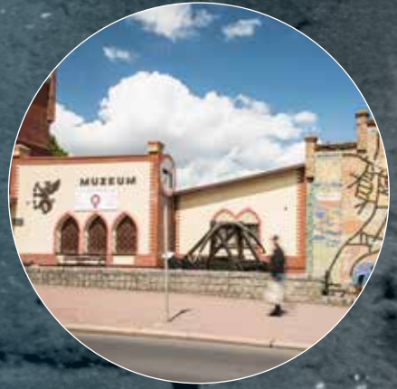
Muzeum Regionalne im. Andrzeja Kaubego ul. Zamkowa 24, 72-510 Wolin